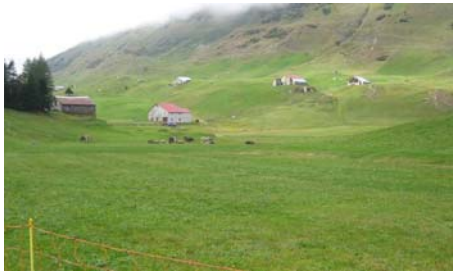
Abb. 1: Das Urserental ist ein vom Gletscher geformtes U- Tal. Hier gibt es auffallend wenig Wald. Im Winter ist das ganze Tal sehr lawinengefährdet. Im Sommer sind auf dem Weg zwischen Andermatt und Hospental vor allem Kühe anzutreffen.

Die Wälder sind eine wichtige Vorbedingung für eine Besiedlung. Sie regulieren den Abfluss des Wassers und reduzieren die Lawinen. Es fällt auf, dass es im Urserental wenig Wald gibt. Mit der Höhe lässt sich dies nicht begründen, da das benachbarte Tavetsch auf gleicher Meereshöhe beträchtlich mehr Wald aufweisen kann. Die theoretische Waldgrenze liegt bei ca. 2'000 m.ü.M. Sie ist aber keine Konstante. Zur Zeit der ersten Siedler muss das Tal walddreich gewesen sein. Schon der Name Urserental weist darauf hin, denn er soll von lat. Ursus (der Bär) abgeleitet sein. Der Bär ist auch das Wappentier der Talschaft. Hauptursachen für die Vernichtung des Waldes sind Lawinen, Übernutzung